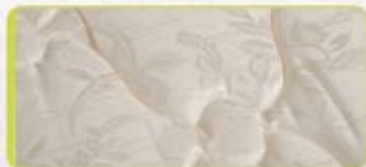
Tapizado con telas Jackard

Altura de colchón: 30 cm Altura total del conjunto: 62 cm